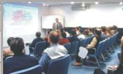
Centro de Entrenamiento