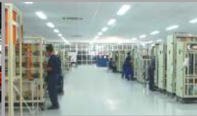
Línea de Montaje de Paneles de Mando y Fuerza