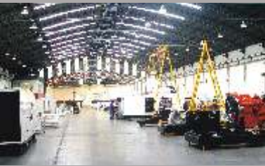
Línea de Montaje de Grupos Electrónicos

Líder en el mercado brasileño en la fabricación y comercialización de grupos electrógenos, STEMAC proyecta y ejecuta soluciones en energía por medio de una amplia estructura de asistencia. Cuenta con 35 sucursales estratégicamente distribuidas en todo Brasil y una red de representación internacional en más de 30 países. Además, STEMAC mantiene alianzas internacionales que garantizan la calidad y la permanente actualización tecnológica de sus productos.