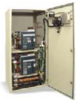
Tablero de Transferencia Automática