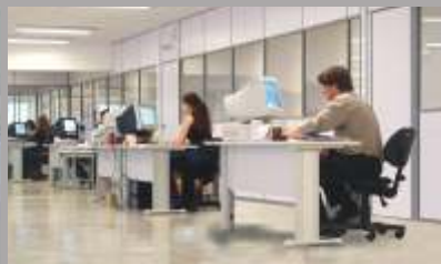
Canal de Servicios y Repuestos