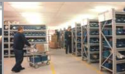
Central de Distribución de Repuestos