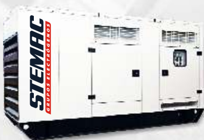
Cabinas Carenadas y Insonorizadas

Además de no requerir obras civiles, las cabinas posibilitan una rápida instalación y permiten movilidad para eventual sustitución. Las cabinas insonorizadas STEMAC están proyectadas en 2 estándares: SL 85 dB(A)@ 1,5m y SSL 75 dB(A)@ 1,5m.