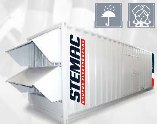
Cabinas Insonorizadas ISO