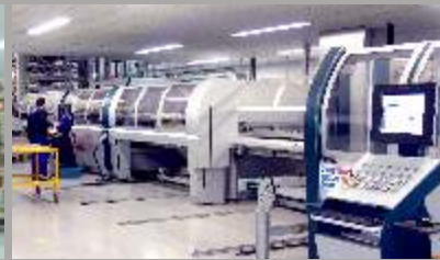
Fabrica de Tableros y Cabinas