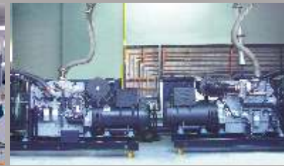
Cabinas de Pruebas