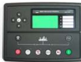
Tablero de Mando Microprocesado